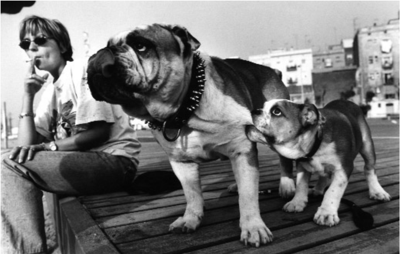
Nadie nace enseñado.

gustaba, no era el que me interesaba. Así que, finalmente, decidí hacerlo por mi cuenta, aunque no descarto que haya una segunda edición con una editorial detrás, a pesar de que el libro ya se puede encontrar en la mayoría de librerías.